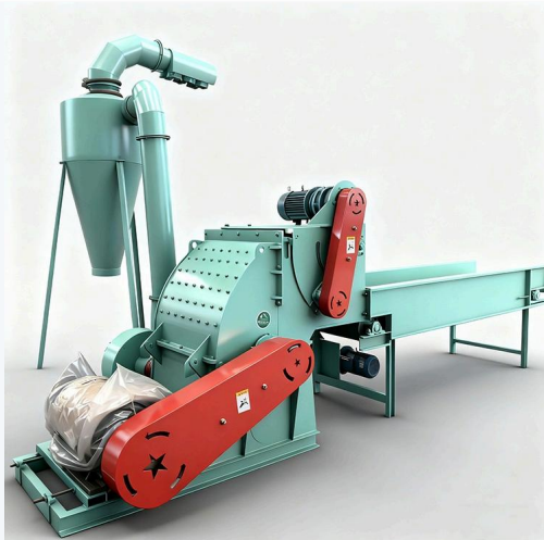
Penghancur pakan paksa · Operasi efisien & stabil