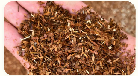
🔹 Substrat jamur