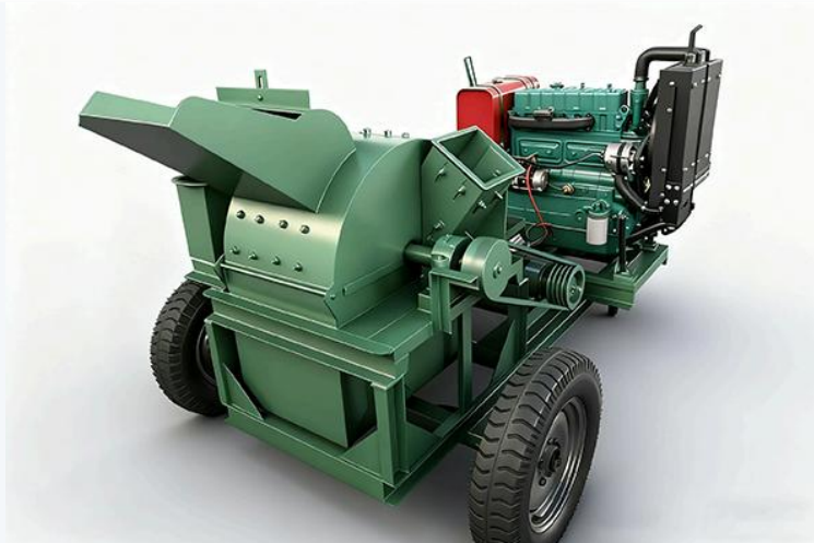
Penghancur Kayu Multifungsi bergerak · Operasi efisien & stabil