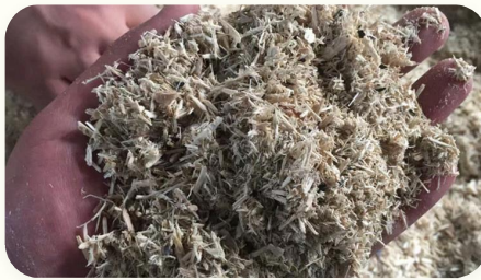
🔹 Bahan baku pelet biomassa