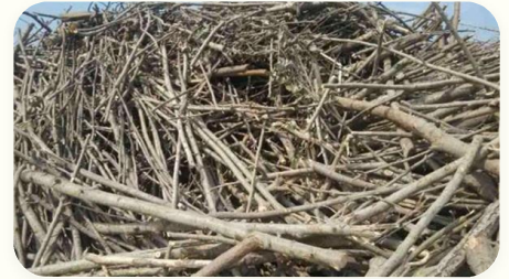
🥥 Kulit kelapa