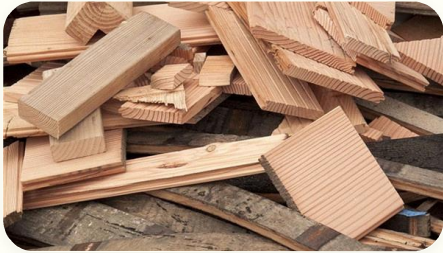
🌲 Serpihan kayu