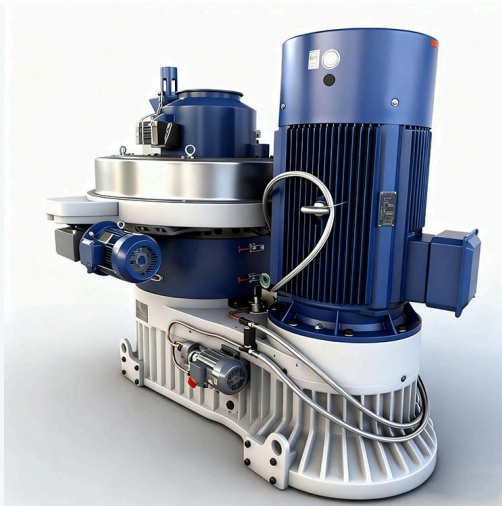
Máy ép viên sinh khối Ring Die · Vận hành hiệu quả và ổn định