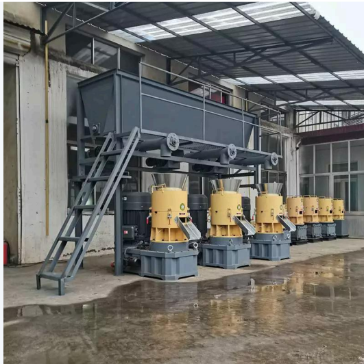
Máy ép viên sinh khối Flat Die · Chứng nhận CE