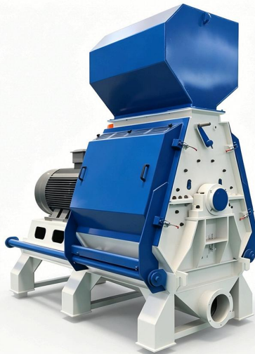
Máy nghiền gỗ Waterdrop · Chất lượng quốc tế