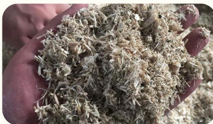
🔹 Nguyên liệu viên nén sinh khối