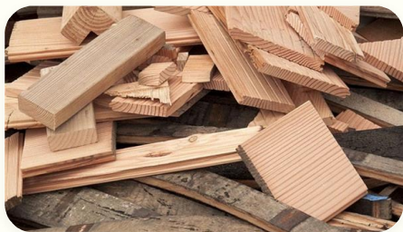
🌲 Phế liệu xường cửa