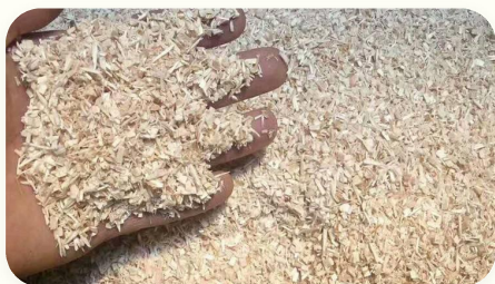
🔹 Dăm gỗ 1~20 mm