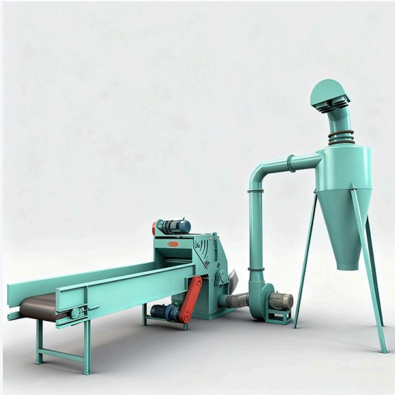
Máy nghiền gỗ cấp liệu cường bức · Chất lượng quốc tế