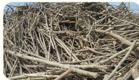
🌿 Rơm/Thân bông