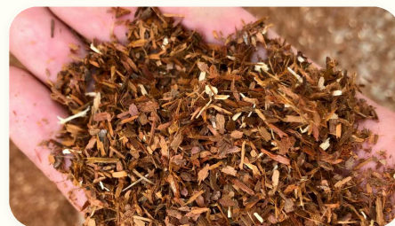
🔹 Giá thể trồng nấm