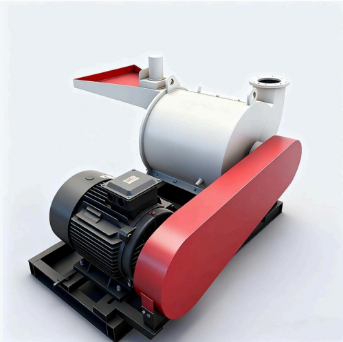
🌲 Máquina horizontal de pó de madeira · Operação eficiente e estável